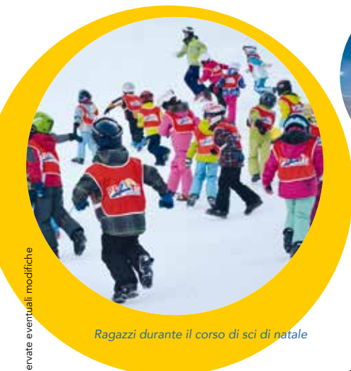
Ragazzi durante il corso di sci di natale

Gli amanti dello sci di fondo hanno a disposizione una bella e variata pista. Il circuito di circa 2 km si snoda fra Prato e Mascengo, è di media difficoltà e accessibile a tutti i livelli. È possibile utilizzare gratuitamente la pista tutti i giorni, anche la sera grazie all'impianto di illuminazione.