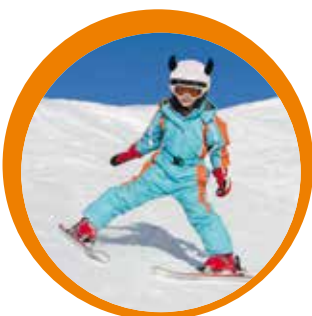
Piste adatte a tutti