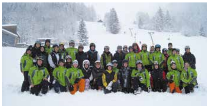
I monitori dello Sci Club Rodi Fiesso