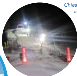
Pista di freestyle