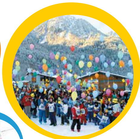
Lancio dei palloncini al termine dei corsi di sci